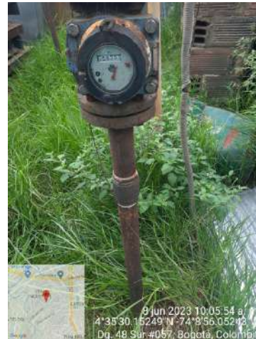
Foto No. 4 Medidor Instalado