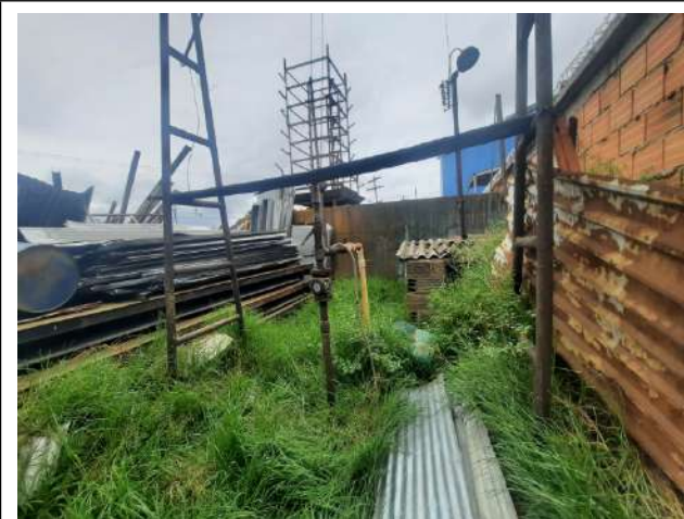
Foto No. 3 Ubicación pozo pz-06-0003

El pozo identificado ante la Entidad con código pz-06-0003 se encuentra inactivo, cuenta con tubería de producción (Foto No. 3), medidor instalado y lectura acumulada de 68551 m 3 (Foto No. 4), la cual coincide con la tomada en la última vista de control realizada el 13 de diciembre de 2016 y reportada en el Concepto Técnico No. 00779 (2017IE30108) del 13 de febrero del 2017. Por las condiciones del área donde se localiza el punto de aguas subterráneas, no fue posible verificar si el sistema de extracción se encuentra inhabilitado y si cuenta con placa de identificación o georreferenciación, no se observan sellos de la SDA instalados. Las condiciones físicas y ambientales alrededor de la captación no son buenas.